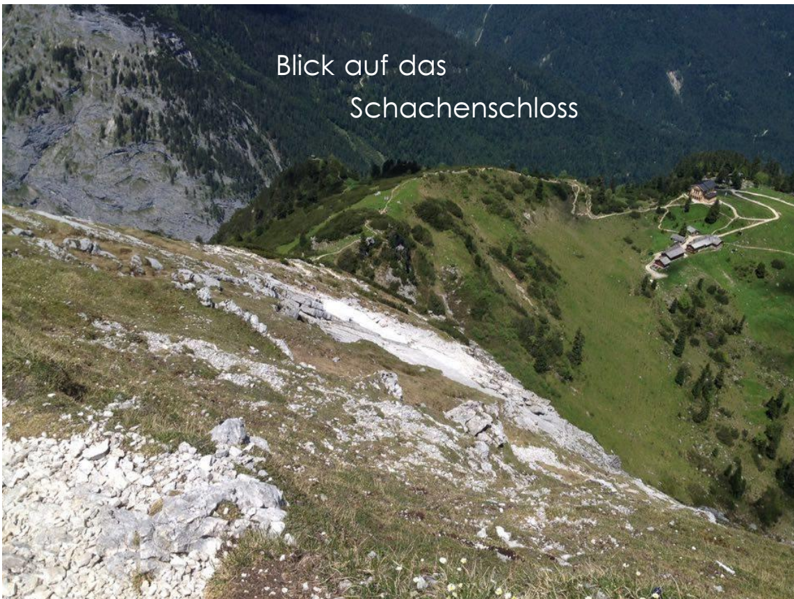
Blick auf das Schachenschloss