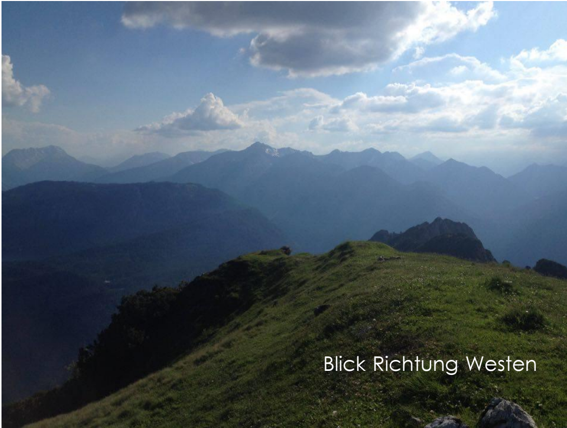
Blick Richtung Westen