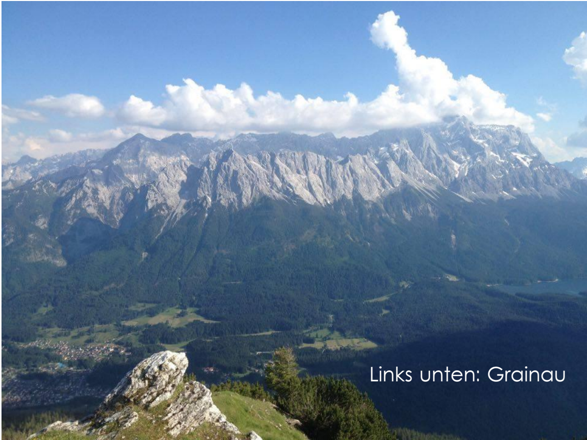
Links unten: Grainau