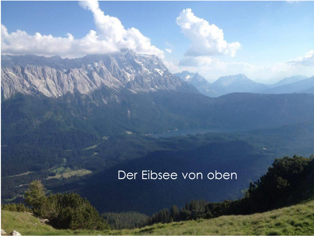
Der Eibsee von oben